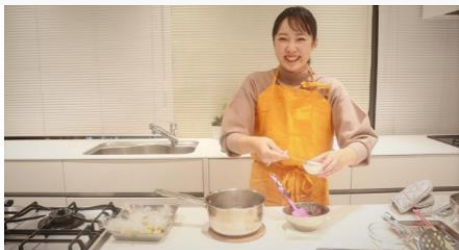
ふるさとの“オイシイもの”をご紹介します(イメージ画像)