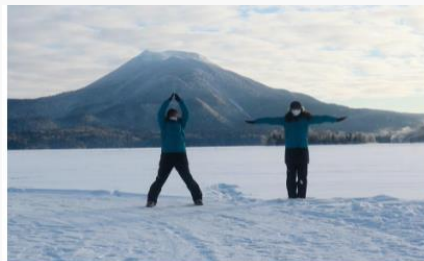
ふるさとの大自然を体当たりレポート(イメージ画像)