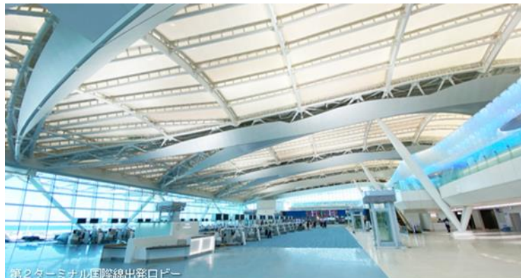
第2ターミナル国際線出発ロビー