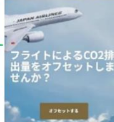
JALカーボンオフセット スマートフォントップページ