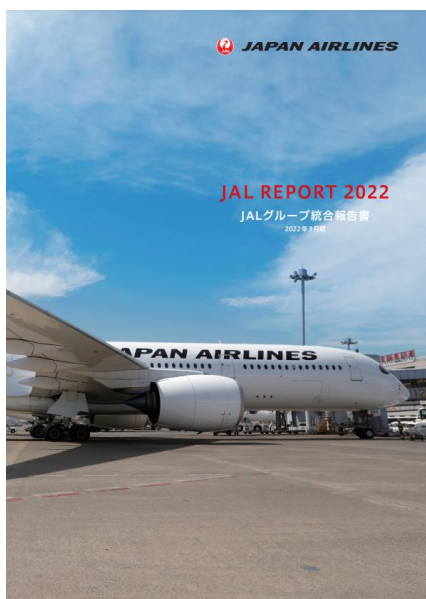
JAL REPORT 2022 表紙

JALグループは、経済的価値と社会的価値の両面で持続的に成長する姿を皆様にご理解いただけるよう、「JAL REPORT」を毎年発行しています。JAL Webサイト上で公開した、2022年3月期版「JAL REPORT 2022」では、「安全・安心」と「サステナビリティ」を骨子としたJAL Vision 2030と、カーボンニュートラルの実現に向けたストーリーをお伝えしています。