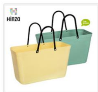
HINZAマルチバッグL 2Pセット(レモン&オリーブ) バイオプラスチック製

上記の情報は、2023年3月6日時点の情報に基づきます。最新の情報はJAL Webサイトでご確認ください。