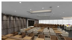
開放感のある空間に配置した様々な座席