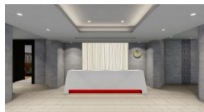
重厚感で落ち着いた雰囲気のあるエントランス