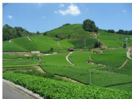
石寺の茶畑

※機内誌「SKYWARD」や国際線・国内線の機内ビデオによる情報発信、国内線ファーストクラス機内食にて京都府産食材などを使用した夕食を提供など