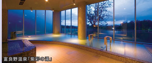
富良野温泉「紫彩の湯」