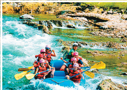
北海道の大自然の中で体験するラフティングは格別！