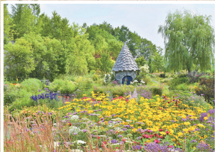
美しい3つのガーデンをお得に巡ることができる共通券