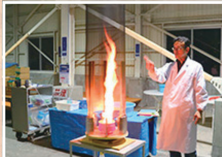
サイエンスショーを通じて科学の不思議を楽しく体験！

夏のわくわくサイエンスショー 1,500円(おとな) *小学生子どもはおとな1名につき2名まで無料